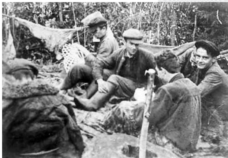
▼ Бандгруппа С. Микулича