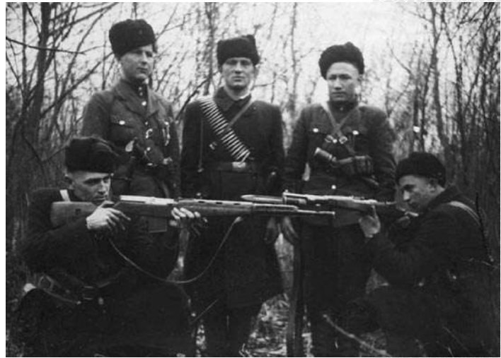
▲ Участники ОУН–УПА

В будущем государстве декларировались свободный труд, свободный выбор профессии и свободный выбор места труда, равенство в правах и обязанностях мужчин и женщин. Программа провозглашала введение пенсионного обеспечения для всех работающих. Медицинское обслуживание объявлялось бесплатным и доступным для всех. Декларировалась свобода печати, слова, мысли, убеждений, веры и миро-