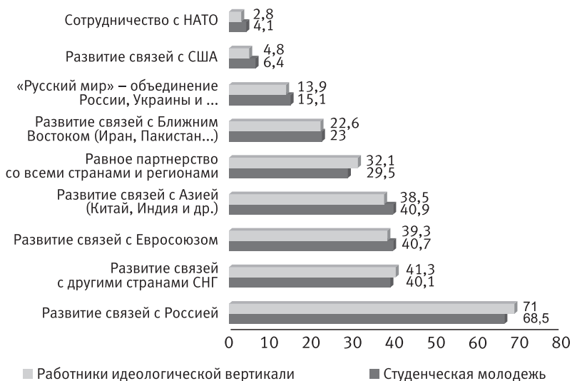
Рисунок 2 – Основные перспективные направления внешней политики Республики Беларусь (сравнение по группам, %)

ми, по мнению респондентов, расширению связей Республики Беларусь с США, ЕС и НАТО, являются «внешнеполитическая и экономическая зависимость от России» и «искусственная внешнеполитическая изоляция Республики Беларусь». «Осознание своей независимости и самобытности» граничит с «экономической и финансовой нецелесообразностью», учитываются также и личные предпочтения руководства страны ( Рисунок 2 ).