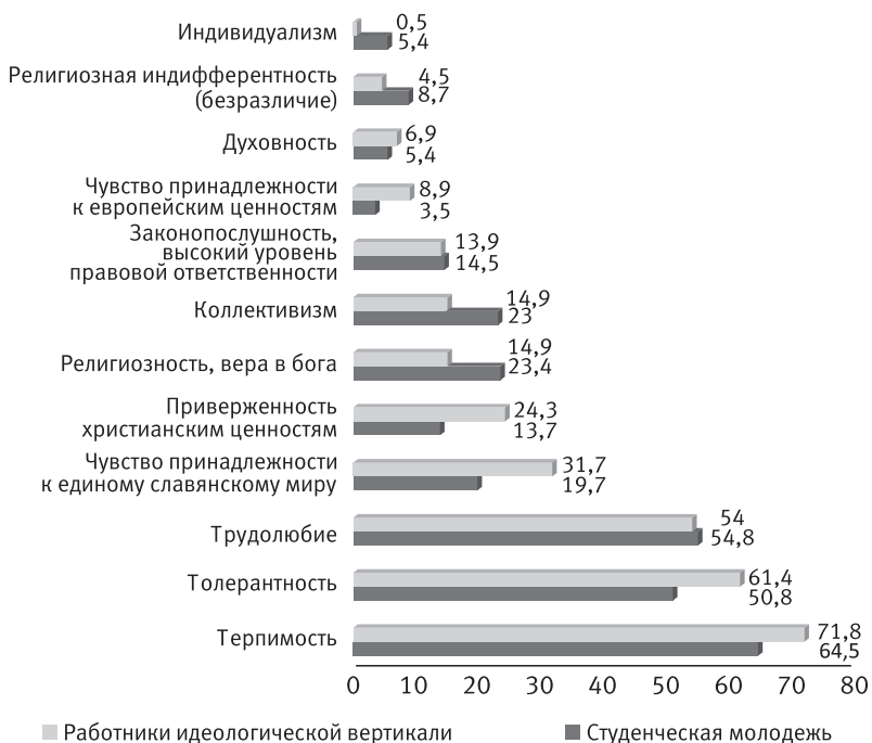
Рисунок 1 – Основные отличительные черты белорусского менталитета (сравнение по группам, %)

ет сильное сознание непрерывности и преемственности русской государственной и общественной традиции, начиная со времени Киевской Руси и заканчивая нынешней Россией, Украиной, Беларуссией» [136].